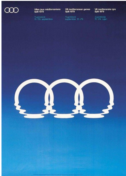
Le logo des Jeux, création Boris Ljubičić

Héritier du jeu (pratiqué depuis la nuit des temps) et des arts martiaux (dont il emprunte les médailles de bravoure), le sport moderne est un spectacle de masse, intimement lié au développement des médias. Si la plupart des équipes de football disposent de deux couleurs de maillot, c'est avant tout pour être bien discernables de l'équipe adverse sur une télévision noir et blanc. Et l'on connaît le penchant des jeunes footballeurs pour les coupes de cheveux aventureuses, leur donnant une visibilité accrue auprès des recruteurs et du public.