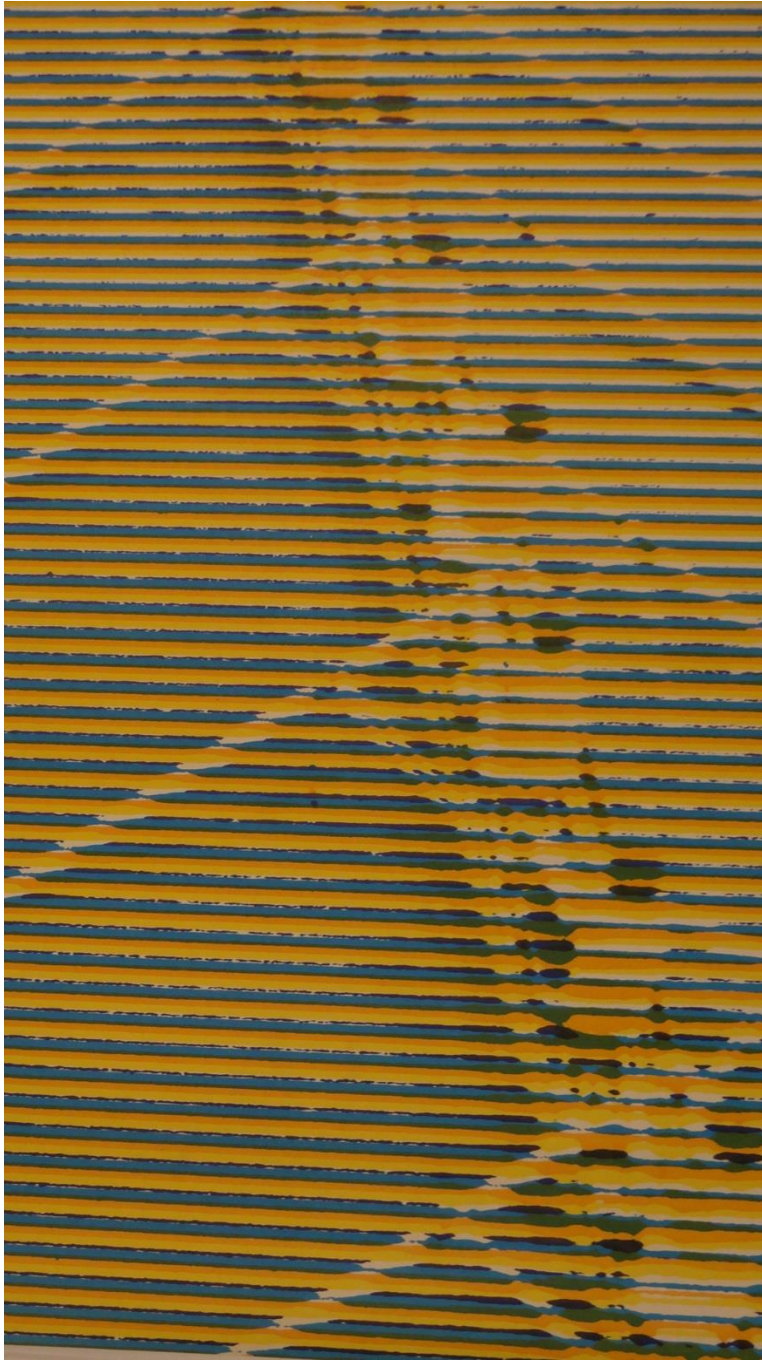
Détail d'une affiche

Boris Ljubičić a une formation de peintre. Son logo pour les Jeux Méditerranéens est une icône. Il figure, rayonnant, au centre de la grande affiche des Jeux, repoussant le texte dans les marges. Les trois anneaux européens, africains et asiatiques semblent plonger dans une mer d'azur, et se reflètent dans ses eaux qui unissent les pays participants. Le logo est associé à la mascotte Adriana, « totem » protecteur des Jeux, sculpture d'Oskar Kogoj reproduite en de nombreuses tailles et matériaux.