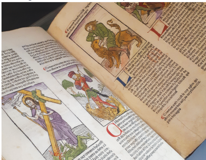
Le Mirouer de la rédemption de l'humain lignage, Martin Husz, 1478

Le Musée de l'Imprimerie et de la Communication Graphique a récemment acquis un incunable, Le Miroir de la Rédemption de l'Humain Lignage , imprimé à Lyon par Martin Husz en 1478. Cet ouvrage compte parmi les imprimés lyonnais les plus anciens. Il est parvenu jusqu'à nous grâce au papetier et bibliophile lyonnais Henri Alibaux au XIX e siècle mais est arrivé dans les collections du Musée de l'Imprimerie et de la Communication Graphique en très mauvaise condition. Une étude de l'état de l'ouvrage, puis sa restauration, ont été engagés par le musée afin qu'il puisse être présenté pour l'exposition L'odyssée des livres sauvés en 2019. À travers une présentation de l'œuvre, de son état puis de sa restauration, nous décrivons le métier de restaurateur d'œuvres d'art et plus précisément les techniques de restauration des papiers et des livres anciens. Nous analyserons les problématiques de restauration que représente un tel ouvrage et les choix d'interventions qui en découlent.