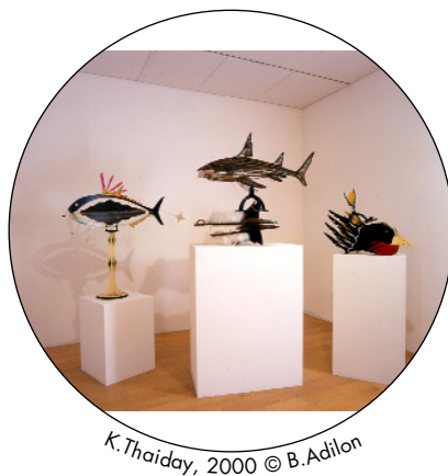
K. Thaiday, 2000

Musée des Beaux-Arts , 20 place des Terreaux, Lyon 1er - Tél : 04 78 38 57 51 (service de presse du MBA) www.mba-lyon.fr