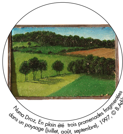
Numa Droz, En plain été trois promenades fragmentées dans un paysage (juillet, août, septembre), 1997