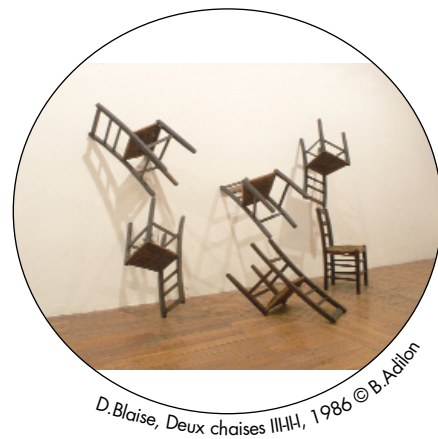
D. Blaise, Deux chaises IIIII, 1986

Musée Urbain Tony Garnier , 4 rue des Serpollières, Lyon 8e - Tél : 04 78 75 16 75 www.museurbaintonygarnier.com