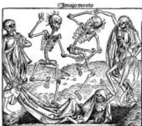
Chroniques de Nuremberg, Bibliothèque municipale de Lyon