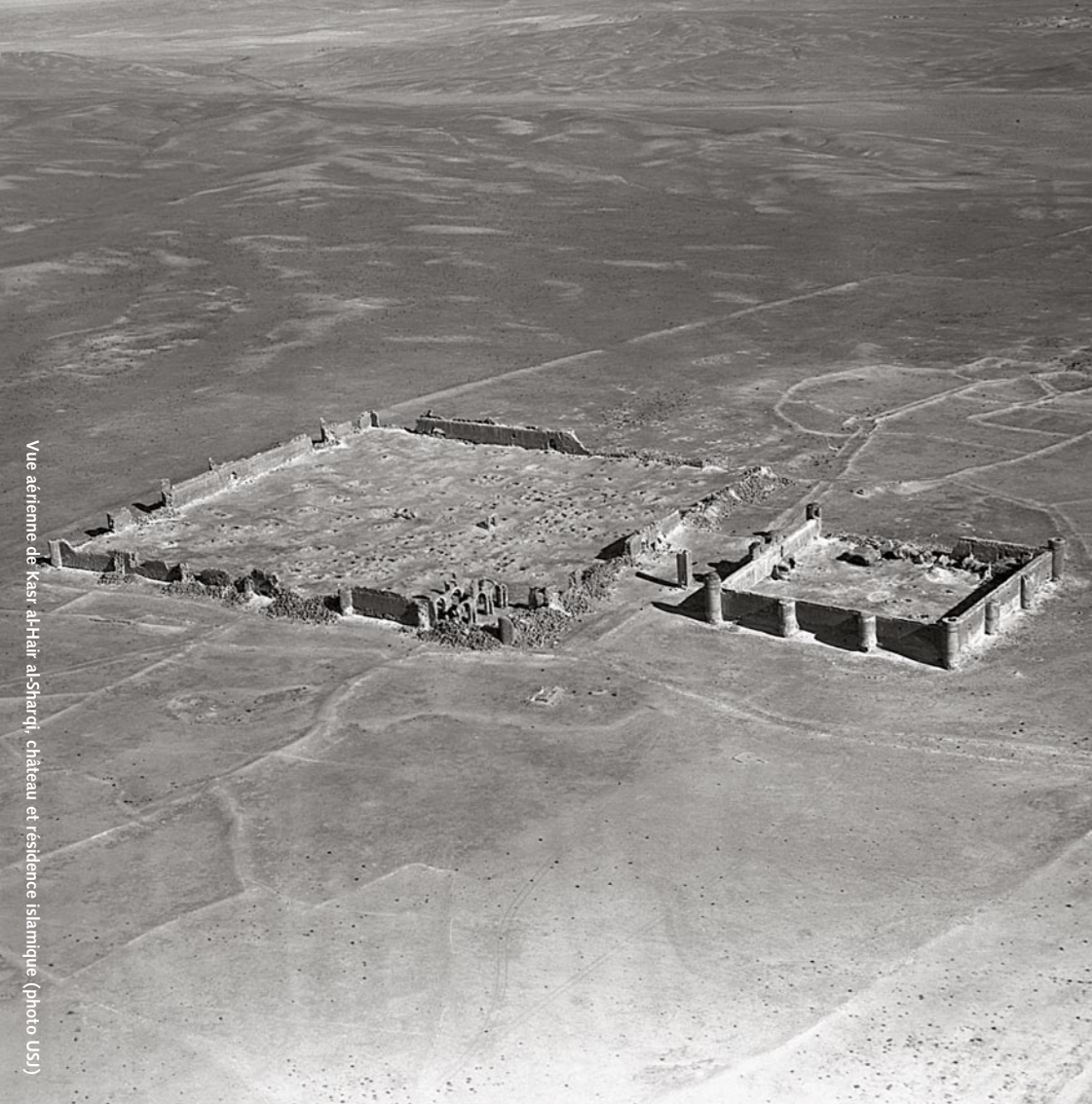
Vue aérienne de Kasr al-Hair al-Sharqi, château et résidence islamique